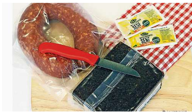
Die Küchenklassiker können Sie genauso im Online-Shop „Bergisch Bestes“ finden, wie ein Kottenbutter-Set oder Original Buckelmesser. Stöbern Sie auf www.bergisch-bestes.de .

ST-Karten-Inhaber gewinnen einen Gutschein über 50 Euro