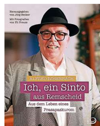
Cover: Dietz-Verlag, Foto: Uli Preuss

Es ist ein Gemeinschaftswerk vom Texter Professor Jörg Becker und dem ehemaligen Tageblatt-Redakteur und Foto-