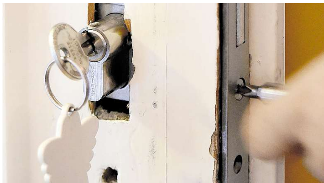
Ist die Tür zu und der Schlüssel steckt von innen – das Schutzengel-Team der Stadtwerke Solingen schickt einen zuverlässigen Schlüsseldienst vorbei.