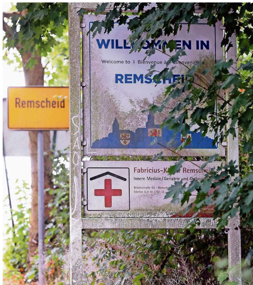
Das Schild an der Hastener Straße/Ecke Dreieangelstraße ist kaum mehr sichtbar. Es ist dreckig und zugewachsen.