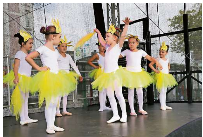
Das äußerst beliebte Stadtteilsten in Hasten bietet auch Kindern eine Bühne.