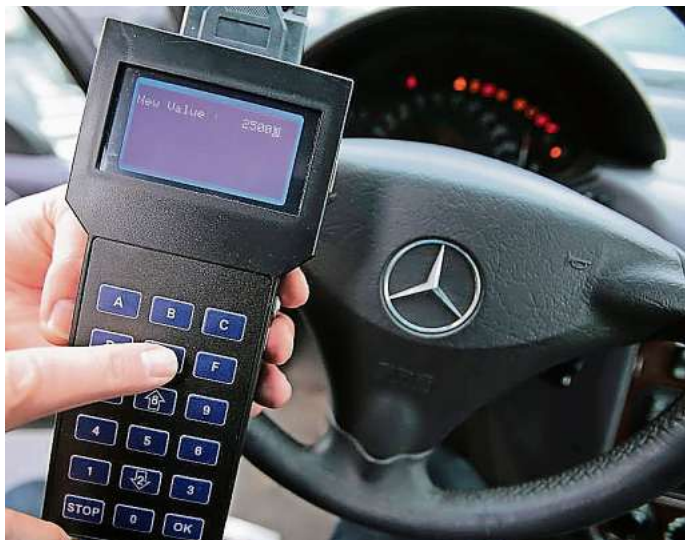
Mit der Manipulation des Kilometerstandes erhoffen sich Betrüger höhere Gewinne beim Gebrauchtwagenverkauf.

- dpa/tmn - Das Angebot klingt verlockend: Der VW Golf VII hat deutlich weniger Laufleistung als vergleichbare Fahrzeuge und kostet ein paar hundert Euro weniger. Doch der Innenraum spricht eine andere Sprache: abgewetzte Sitzwanen, stark abgegriffenes Lenkrad und eingerissene Gummis an den Pedalen. Die Wahrscheinlichkeit, dass bei solchen Autos der Verkäufer am Tachostand gedreht hat, ist hoch. Nach Angaben des ADAC und der Polizei stimmt bei jedem dritten in Deutschland verkauften Gebrauchtwagen der Kilometerstand nicht.