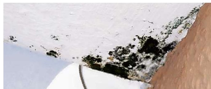
Schimmel in der Wohnung ist hässlich und gefährlich: Bausachverständige klären die Ursache.

Das gilt selbst dann, wenn ein Gutachter feststellt, dass die nachts geschlossene Schlafzimmertür mit ursächlich für die Feuchtigkeitsschäden gewesen sei. Das Landgericht Bochum stellte fest, dass das Offenhalten der Schlafzimmertür während der Nacht kein übliches, von einem durchschnittlichen Mieter zu erwartendes Lüftungsverhalten darstelle (Az.: I-11 S 33/16).