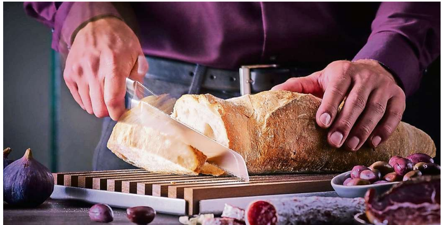
ST-Karten-Inhaber können einen Gutschein im Wert von 49 Euro gewinnen. Sie erhalten damit die Möglichkeit, an einem Schärf- und Schneidkurs bei Ed. Wüsthof Dreizack teilzunehmen.