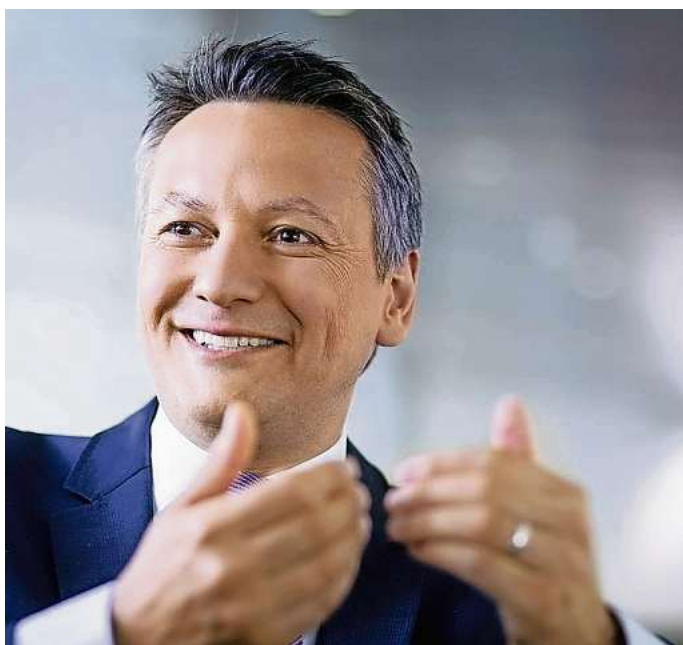
Bergisches Wissensforum 2020: Cristián Gálvez spricht über das Abenteuer Veränderung.

ST-Karte bereithalten, anrufen & gewinnen: 01379 - 88 63 80 Oder per SMS an: 1111* [SMS-Stichwort, Leerzeichen, Kunden-Nr.]