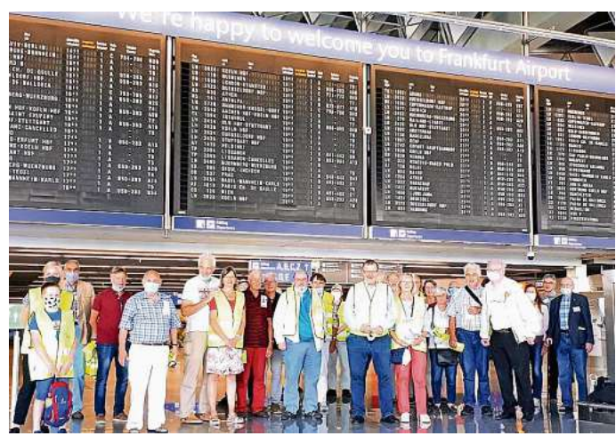
Am 30. Juli besichtigten ST-Leser den Frankfurter Flughafen. Sie waren alle sehr beeindruckt.

Weitere Informationen und Anmeldung bei chronotours unter ☎ (02 21) 165 335 12.