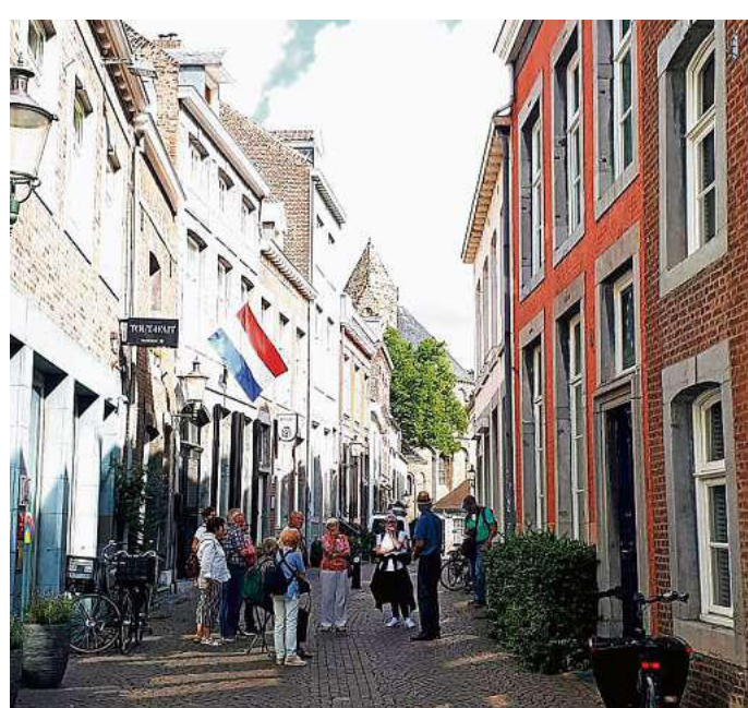
ST-Leser hatten viel Vergnügen beim Ausflug mit chrono tours in der Maastrichter Innenstadt.

40 ST-Leser waren am 27. August zu Gast in der Kulturmehropole Maastricht. Eine erste Orientierung über die Sehenswürdigkeiten der Stadt verschaffte eine Stadtführung, in kleinen Gruppen. Die Leser flanieren entlang der schönsten Orte in der Altstadt, passierten die Stadtmauern, das Jekerkwartier und den Vrijthof, auf dem André Rieu alljährlich seine Sommerkonzerte gibt. Nach einem gemeinsamen Mittagessen stand dann eine Schifffahrt über die Maas auf dem Tagesprogramm, bevor die Teilnehmer Maastricht eigenständig erkunden konnten.