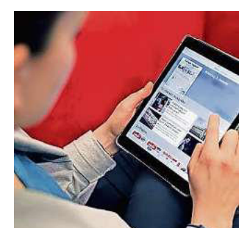
Sie können das E-Paper während des Urlaubs lesen.

Wer seine Zeitung nicht lesen will, kann sein ST einer sozialen Einrichtung überlassen. Sie machen damit anderen eine große Freude. Als Dankeschön erhalten Sie bei einer Spende ab sechs Tagen eine kostenfreie Belieferung von sechs Ausgaben eines Zeit-