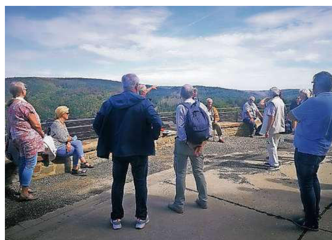
ST-Leser erlebten einen Tag in der Eifel - mit Ausflug auf die Ordensburg Vogelsang und einer Schifffahrt über den Rursee.

Weitere Informationen und Anmeldung bei chronotours bitte unter: ☎ (02 21) 165 335 12.