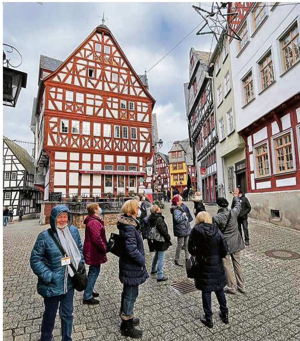
In Limburg an der Lahn tauchte die Gruppe bei einer Stadtführung in die spannende Stadtgeschichte ein.