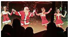
Der Remscheider Weihnachts-circus.