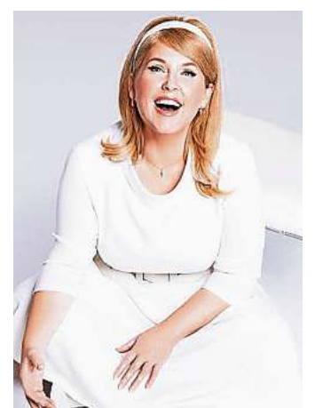
Maite Kelly geht 2022 auf große Tour.