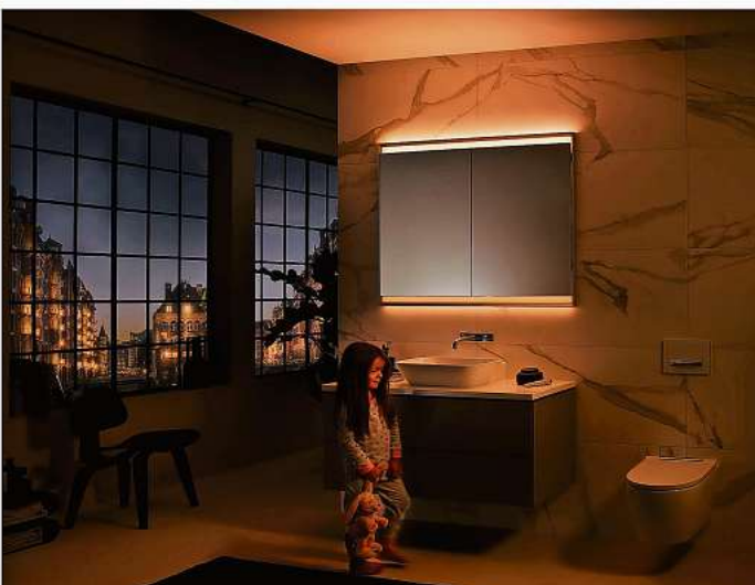
Für jede Tageszeit die passende Beleuchtung: helles Tageslicht, Arbeitslicht zum Frisieren, Schminken oder Rasieren, warmes Abendlicht und sanftes Orientierungslicht für die Nacht.

ramik und die Armatur gut in Szene setzt. Optimal ist es, wenn sich die Abstrahlwinkel der einzelnen Lichtquellen leicht überschneiden, so dass ein optimales Gesamtbild entsteht. Der Clou an innovativen Spiegelschränken ist die