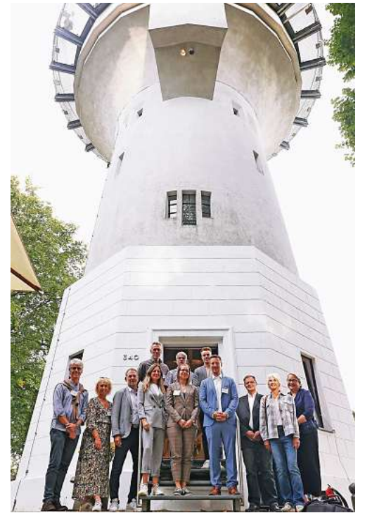
Zum ersten Konzert der Bergischen Erlebniswelten im Gräfrather Lichtturm haben die Organisatoren auch die Kooperationspartner der anderen Angebote eingeladen.