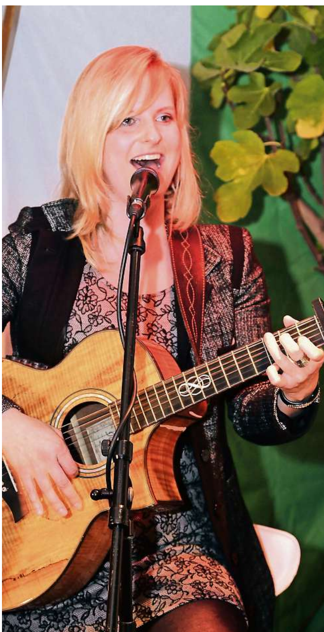
Die Solinger Sängerin Teneja wird bei „Wald leuchtet“ zweimal aufreten.

► „Freudenhaus“ Concept Store, Friedrich-Ebert-Straße 114 Aktionen und Verlosung zum fünfjährigen Bestehen