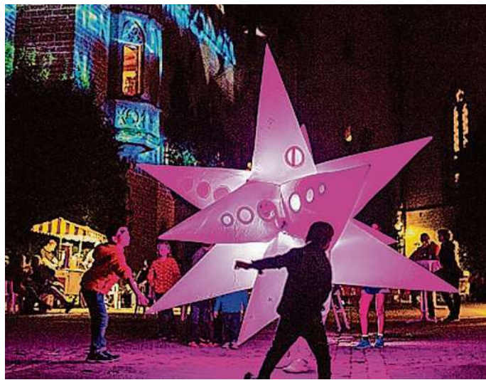
Mit bunten Sternschnuppen will die Show „Sternenglück“ die Walder bei „Wald leuchtet“ verzaubern.